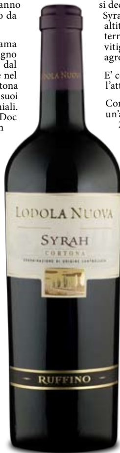
Syrah Cortona DOC

si decide di impiantare nei territori collinari di Cortona alcuni ettari di Syrah, un vitigno in grado di eccellenti prestazioni in quei terreni. Le altitudini abbastanza elevate, le grandi escursioni termiche di questo territorio rappresentano, infatti, il microclima ideale per questo vitigno. Un binomio "vitigno-ambiente" che guida da anni le scelte agronomiche di Ruffino.