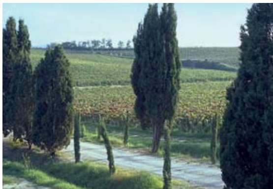
Tipico paesaggio ilcnese nei pressi della Tenuta

è risultato – a un suo primo assaggio in anteprima - un vino elegante e corposo al tempo stesso, che stupisce per la sua chiara linea di equilibrio che ha caratterizzato l'annata 2006. Tutto è nato nel 2001 quando il team di Ruffino, insieme con Carlo Ferrini, decidono di dare avvio ad un nuovo progetto. Coerentemente con la filosofia della "vocazione viticola"