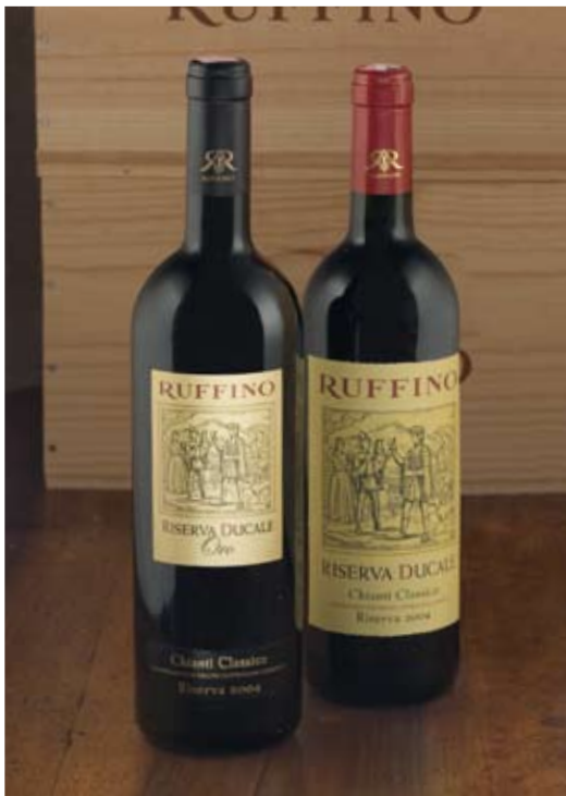
Riserva Ducale Oro Chianti Classico DOCG e Riserva Ducale Chianti Classico DOCG

Riserva Ducale racconta un territorio, l'evoluzione del gusto, come testimoniano le grandi verticali che a ritroso ripercorrono un'epoca: i primi vini in fiasco, uve bianche con uve nere, la botte grande, poi la botte piccola e ancora la botte grande con la botte piccola. Un secolo o quasi di evoluzione del gusto, sempre fedele ai principi di un Sangiovese toscano, di un approccio inizialmente non facile, che si svela lentamente e poi seduce, senza lasciarti più, bicchiere dopo bicchiere, anno dopo anno.