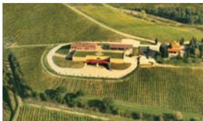
Veduta aerea della Tenuta di Lodola Nuova

La recente collaborazione avviata con Carlo Ferrini – enologo dell'anno secondo i 'Wine Star Awards' 2007, prestigioso premio assegnato da 'Wine Enthusiast', non poteva che condurre a una nuova sfida.